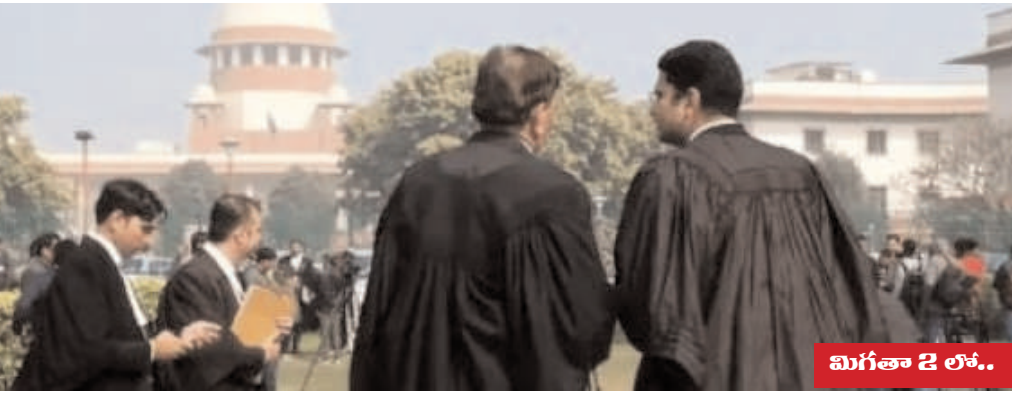
మిగతా 2 లో..