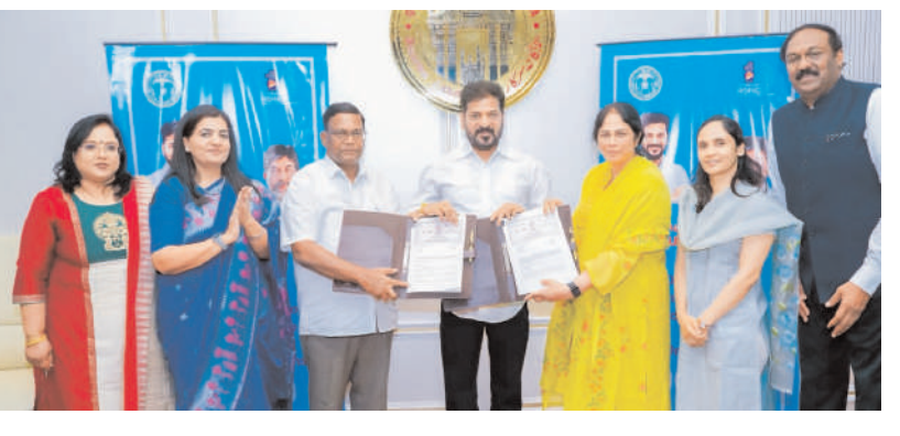
హైదరాబాద్, మే 23 మన ప్రజాగళం: తెలంగాణలో ప్రభుత్వ పాఠశాలల అభివృద్ధి, విద్యారంగ బలోపేతానికి మిగతా 2 లో..