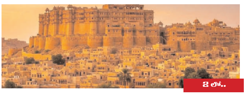
మిగతా 2 లో..