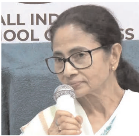
కొలకతా, 07 మే (మన ప్రజాగళం): ఆసెంబ్లీ ఎన్నికల ఓటమి తర్వాత ఇప్పటికే ఒత్తిడిలో ఉన్న తృణమూర్తి కాంగ్రెస్ లో తాజాగా కొత్త చర్య మొదలైంది. పార్టీ అధినేత్రి మమతా బెనర్జీ నిర్వహించిన కీలక సమావేశానికి వది మంది ఎమ్మెల్యేలు గైర్జాబరు కావడం

రాజకీయ వర్గాల్లో ఆసక్తికర చర్యకు దారితీసింది. ఎన్నికల ఫలితాల తర్వాత పార్టీ పరిస్థితి, భవిష్యత్ వ్యూహాలపై చర్చించేందుకు ఏర్పాటు చేసిన ఈ సమావేశం ఇప్పుడు రాష్ట్ర రాజకీయాల్లో ప్రధాన అంశంగా మారింది. ఆసెంబ్లీ ఎన్నికల్లో డీఎంసీ నుంచి మొత్తం 80 మంది ఎమ్మెల్యేలు విజయం సాధించారు. అయితే మమతా బెనర్జీ నిర్వహించిన సమావేశానికి కేవలం 70 మంది మాత్రమే హాజరయ్యారు. దీంతో మిగిలిన పది మంది ఎమ్మెల్యేల గైర్జాబరు పార్టీలో అంతర్గత అసంతృప్తికి సంకేతమా అనే ప్రశ్నలు తలెత్తితున్నాయి. ముఖ్యంగా ఎన్నికల ఓటమి తర్వాత పార్టీ క్రేణుల్లో ఇప్పటికే నిరుత్సాహం నెలకొన్న సమయంలో ఈ పరిణామం మరింత ప్రాధాన్యం సంతరించుకుంది. సమావేశంలో పార్టీ భవిష్యత్ కార్యాచరణ, ప్రతిపక్షంగా అనునరించాల్సిన వ్యూహాలు, కేంద్రను మట్టి వైతన్యపరచడం వంటి అంశాలపై చర్చ జరిగినట్లు సమాచారం. ఎన్నికల ఫలితాల తర్వాత కార్యకర్తల్లో నెలకొన్న నిరాశను తొలగించి పార్టీని బలోపేతం చేయడంపై మమతా బెనర్జీ ప్రత్యేకంగా దృష్టి పెట్టినట్లు రాజకీయ వర్గాలు చెబుతున్నాయి. అయితే