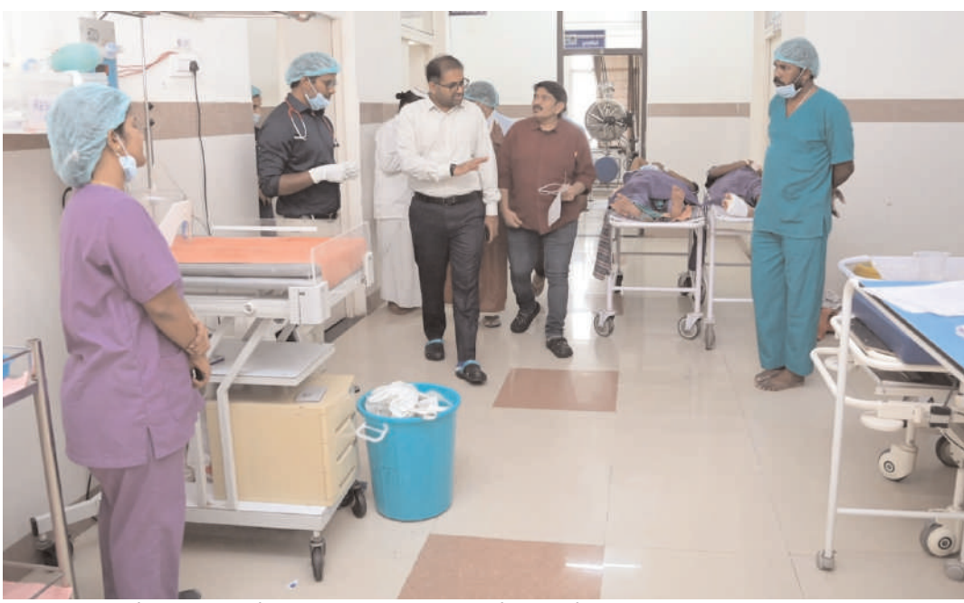
మెరుగైన వైద్య సేవలు అందించేందుకు ప్రభుత్వం చర్యలు తీసుకుంటోందని అధికారులు తెలిపారు.