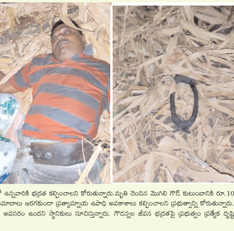
జయశంకర్ భూపాలపల్లి, (మన ప్రజాగళం):