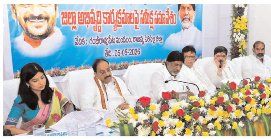
మిగతా 2 లోకం