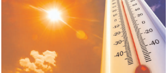
మిగతా 2 లోకం