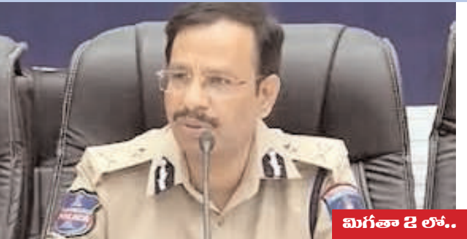
మిగతా 2 లో..

హైదరాబాద్ నగరంలో పెట్రోల్, డీజిల్ కొరత ఉండటా సోషల్ మీడియాలో వస్తున్న వార్తలు పూర్తిగా నిరాధారమని ప్రభుత్వం స్పష్టం చేసింది. విపరీతంగా కొనుగోలు చేయడం వల్ల సమస్యలు వస్తున్నాయన్నారు. హైదరాబాద్ నగరంలో పెట్రోల్, డీజిల్ కొరత ఉండటా సోషల్ మీడియాలో వస్తున్న వార్తలు పూర్తిగా నిరాధారమని ప్రభుత్వం, పోలీస్ యంత్రాంగం స్పష్టం