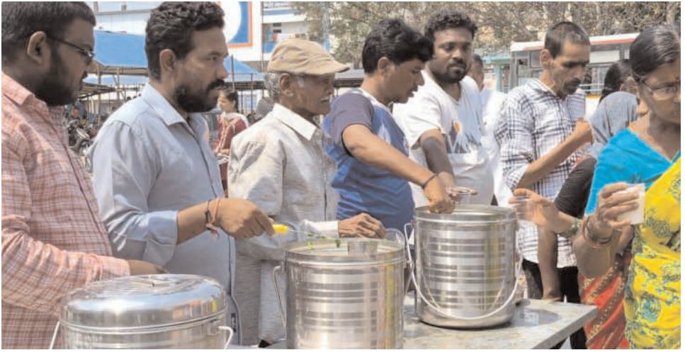
జనగామ, మార్చి 25, మన ప్రజాగళం వల్లమజ్జిగ తో ఉపకమనం కలిగించే పనలో అమ్మ జనగామ బస్టాండ్ లో ప్రయాణికులకు విద్యార్థులకు ఫౌండేషన్ టీం ఆధ్వర్యంలో ప్రయాణికులకి విద్యార్థులందరికీ