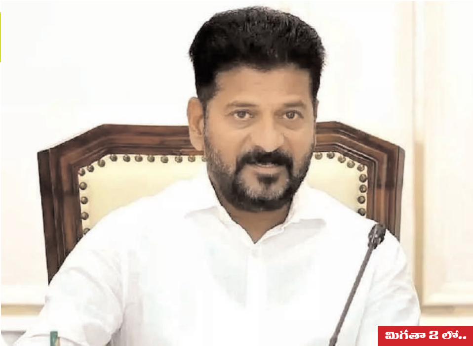
మిగతా 2 లో..

“ఇందిరమ్మ ఫ్యామిలీ లైఫ్ ఇన్ఫూరెన్స్ స్కీమ్”కు సంబంధించిన పూర్తి విధి విధానాలింకా రూపొందించలేదు. కేంద్ర పథకం గ్రావీజీడీతో తెలంగాణ స్కీమ్ను కలపగలరా అనే ఆలోచనపై ఇప్పటికేలాంటి సృష్టణ లేదు. తెలంగాణ ప్రభుత్వ బడ్జెట్లో అత్యంత ఆకర్షణీయమైన ప్రకటన “ఇందిరమ్మ ఫ్యామిలీ లైఫ్ ఇన్ఫూరెన్స్ స్కీమ్”. డిప్యూటీ సీఎం భట్టి విక్రమార్కు బడ్జెట్ ప్రసంగం ప్రకారం, 2026 జూన్ 2 నుంచి రాష్ట్రంలోని 1.15 కోట్ల కుటుంబాలకు రూ.5 లక్షల జీవిత బీమా కల్పిస్తామని ప్రభుత్వం ప్రకటించింది. పేదలు, మధ్యతరగతి, ధనికులు అనే తేడా లేకుండా అందరికీ ఈ పథకం వర్తిస్తుందనడం వల్ల ఈ హామీ సాధారణ సంక్షేమ పథకాన్ని మించిన రాజకీయ ప్రాధాన్యం సంతరించుకుంది. ఈ పథకం కుటుంబంలో సంపాదించే వృత్తి మరణిస్తే ఆ కుటుంబం ఒక్కసారిగా ఆర్థికంగా కుంగిపోకుండా రక్షించే సోషల్ సెక్యూరిటీ స్కీం అనొచ్చు. తెలంగాణ రాష్ట్రమే మొదటిదా.. ఉపముఖ్యమంత్రి బడ్జెట్ ప్రసంగంలో చెప్పినట్లు తెలంగాణ యే దేశంలో మొదటిదా అంటే కాదని చెప్పొచ్చు. ఎందుకంటే నాగాలాండ్ ఇప్పటికే పేరుతో 2024 ఆగస్టు 15న ఒక రాష్ట్రవ్యాప్త కుటుంబ-ఆధారిత బీమా మోడల్ను ప్రారంభించింది. ఆ పథకంలో కుటుంబ పోషకుడు మరణించినప్పుడు రూ.2 లక్షల జీవిత బీమా కల్పించింది. అయితే లబ్ధిదారుల సంఖ్యాపరంగా చూస్తే కేవలం 2.5 లక్షల కుటుంబాలు మాత్రమే అంటే తెలంగాణ లబ్ధిదారుల్లో అవి కేవలం 2.1 శాతం మాత్రమే.. అందువల్ల తెలంగాణ మొట్టమొదటి రాష్ట్రం కాదు కానీ కోటి పదిహేను లక్షల కుటుంబాలు లక్షంగా ఇంత పెద్ద స్థాయి పథకం మాత్రమే తెలంగాణ మాత్రమే అని చెప్పొచ్చు.