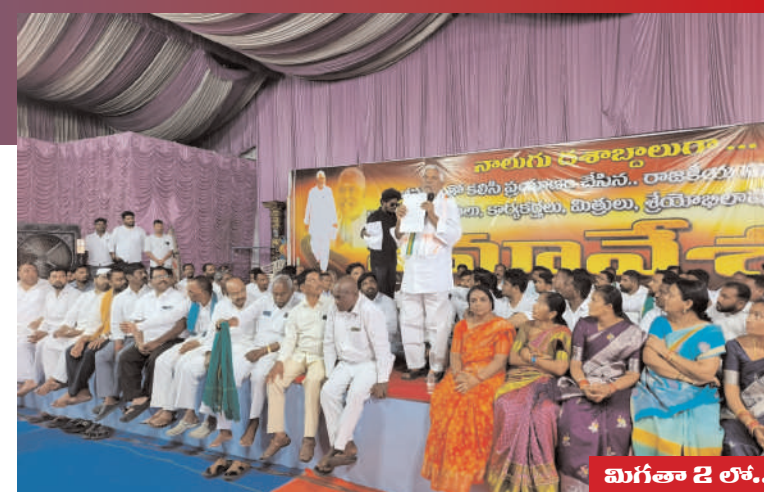
మిగతా 2 లో..

కాంగ్రెస్ కందువా వేసుకొని.. ఇందిరా భవన్ నుండి అభిమానులు, కార్యకర్తలు, నాయకుల నినాదాల మధ్య స్థానిక జంటి హనుమాన్ ఆలయం వరకు కాలినడక వెళ్ళి కొబ్బరికాయ కాయ కొట్టి, పూజలు చేసి, స్థానిక బండారి గార్డెన్ వరకు వాహనంలో తరలి వెళ్ళారు. విధి లిఖితం నాలుగు దశాబ్దాల అనుబంధం పదులుకోవలని ఎవరు కోరుకోరు.. విధి లేని పరిస్థితి లో నిర్ణయం తీసుకున్నా ఈ స్థాయికి మిత్రులు, అభిమానులు, నాయకులు కార్యకర్తలు తోడ్పడ్డారు. 1984 లో కాంగ్రెసు పార్టీ చేరిన.. ఎన్నికల్లో గెలవడం ఓడటం సహజం.. ఉమ్మడి రాష్ట్రంలో జగిత్యాల జిల్లాలో విస్తామము. స్థానిక సంస్థల ఎన్నికల్లో పోటీ చేసేందుకు ఎవరు ముందుకు రాని పరిస్థితిలో సైతం స్థానిక సంస్థల ఎన్నికల్లో కాంగ్రెస్ పార్టీ విజయం సాధించడం